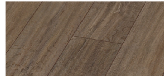
ES1932W-BR 193mm x 8mm x 1380mm