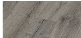
ES1932W-AS 193mm x 8mm x 1380mm