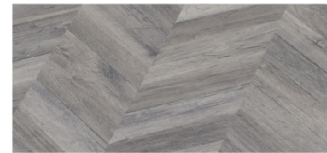
ES1932W-BN 193mm x 8mm x 1380mm