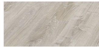
ES1932W-GT 193mm x 8mm x 1380mm