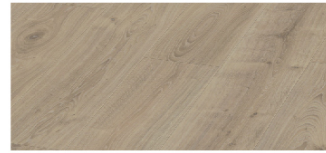
ES1932W-NK 193mm x 8mm x 1380mm