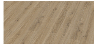
ES1932W-BD 193mm x 8mm x 1380mm