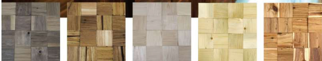
北美胡桃木 Leathersed Walnut

「木立方」為Ua最新創意之木作，將原木以人工精削成95mm立方體，呈現出最原始之自然風格，將其堆砌拼湊並藉由大膽自由的風格融入，讓設計穿透心靈，在柔性氛圍的經營下，構築成一面讓人動心的停格風景。