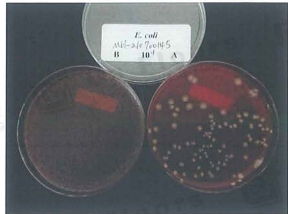
圖二：對照組及試驗物質與大腸桿菌作用 24 小時後之結果。