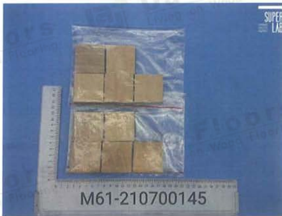
圖一：試驗物質外觀。